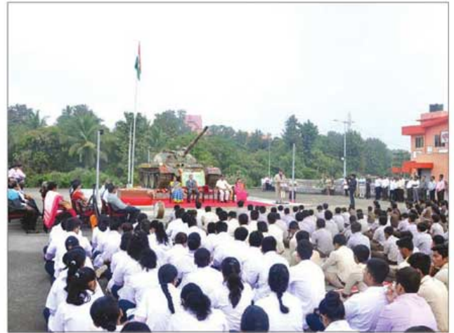
समारंभाला उपस्थित प्रेक्षकवर्ग