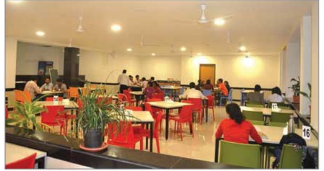
'ऑलिम्पिक कॅफे'च्या हॉलची अभिरुचीपूर्ण सजावट