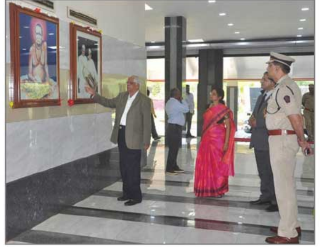
श्रीकाकामहाराज पाहुण्यांना संस्थेविषयी माहिती देताना

बोलणे खूप सोपे असते पण दूरदृष्टी ठेवून चांगल्या संकल्पना अंमलात आणणे फार कठीण असते. तुमच्या संस्थेमध्ये ते सामर्थ्य आहे! तुमच्या संस्थेतील चारित्र्यवान व पवित्र विचार असलेल्या विद्यार्थ्यांनी शक्यतो आमच्या पेशात यावे कारण पोलीस हे समाजचक्राचे केंद्रबिंदू असतात. ज्यांच्या हाती कायदा व सुव्यवस्था आहे, ते जर चांगल्या विचारांचे (चारित्र्यवान) असतील तर समाजामध्ये ते शांती प्रस्थापित करतील. तेव्हा येथे उत्तम संस्कार झालेल्या व्यक्तींनी शासकीय यंत्रणेत येऊन समाजमनामध्ये आमूलाग्र नैतिक बदल करावेत.