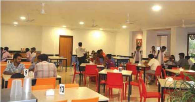
'ऑलिम्पिक कॅफे'चा प्रशस्त हॉल