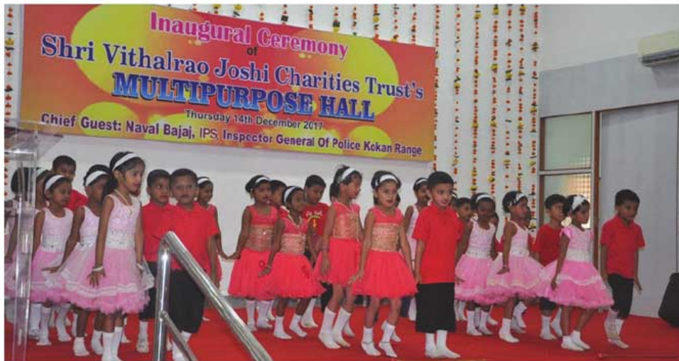
बालवाडीच्या विद्यार्थ्यांनी सादर केलेले नृत्य