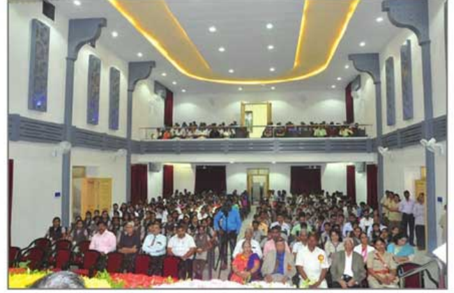
भव्य मल्टिपर्पज हॉल