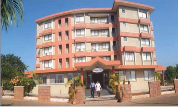
'ऑलिम्पिक कॅफे'ची भव्य इमारत