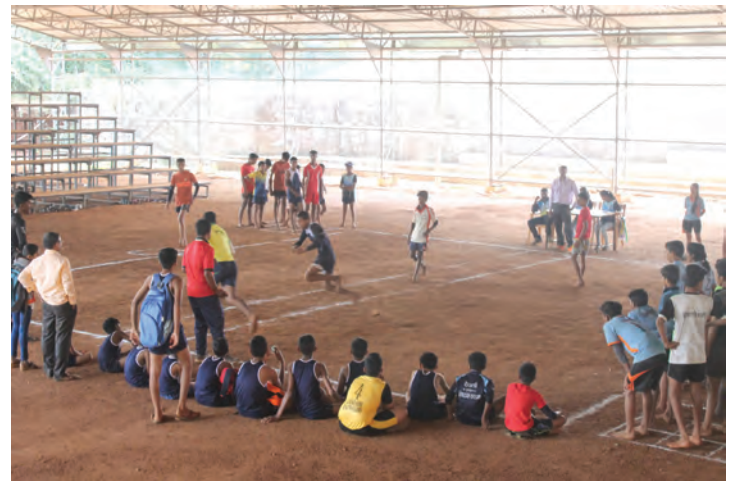
लंगडी स्पर्धेतील क्षणचित्रे