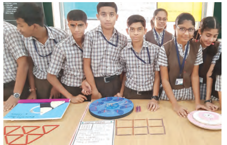
आपल्या प्रतिकृती अभिमानाने दाखविताना विद्यार्थी

तसेच 'गणित प्रश्नमंजुषा स्पर्धे'चे सुध्दा आयोजन केले गेले. ही स्पर्धा लहान गट (इ. ५ वी ते ७ वी) व मोठा गट (इ. ८ वी ते १० वी) अशी घेतली गेली. प्रत्येक गटामध्ये एमराल्ड, रूबी, सफायर व टोपाझ अशा चार विभागांमध्ये ही स्पर्धा झाली. लहान गटात सफायर हाऊस तर मोठ्या गटात रूबी हाऊस विजेते ठरले. या स्पर्धेमुळे तोंडी गणिती क्रिया व कमीत कमी वेळेत गणित सोडवण्याची पध्दत व सवय किती महत्त्वाची आहे हे विद्यार्थ्यांना समजले. स्पर्धेत सहभागी विद्यार्थ्यांबरोबरच शाळेतील इतर विद्यार्थी व शिक्षकवर्ग यांनी या स्पर्धेचा आनंद घेऊन गणित दिन उत्साहात साजरा केला.