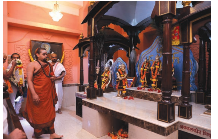
श्रीसमर्थ-श्रीराम मंदिरात स्वामीजी

डेरवणच्या भव्य क्रीडासंकुलाची स्वामीजींनी अत्यंत आस्थापूर्वक पाहणी केली. शूटिंग रेंजमधील सरावाची शस्त्रे, सरावाच्या पद्धती, खेळाडूंचे विशिष्ट पोशाख आदींची अगदी बारकाईने पाहणी करून स्वामीजींनी जिम्नॅशियमचे बंदिस्त क्रीडांगण, जलतरण तलाव, देशी खेळांचे बंदिस्त मैदान, धनुर्विद्येची प्रात्यक्षिके आदी गोष्टींचे लक्षपूर्वक निरीक्षण केले. 'सिंथेटिक रनिंग ट्रॅक' पाहून तर जगदुरु फारच प्रभावित झाले. मेडिकल कॉलेजच्या मुलांचे अभिवादन