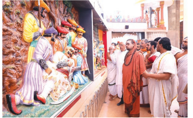
शिव-समर्थगडाच्या सभागृहात ऐतिहासिक शिल्पचित्रे पाहताना श्रीस्वामीजी