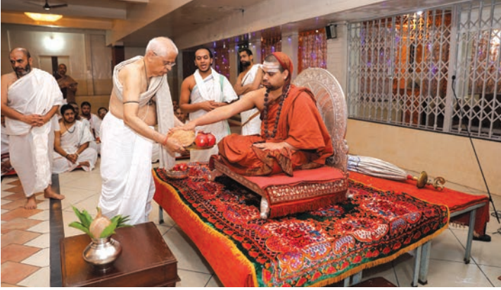
स्वामीजींकडून श्रीकाकामहाराजांना प्रसाद अर्पण

स्वामी जेव्हा श्रीराम मंदिरासमोरील सभागृहात येऊन स्थानापन्न झाले त्या वेळी भक्तगणांच्या विनंतीला मान देऊन त्यांनी उपदेशात्मक असे प्रवचन करून सर्व भक्तगणांना प्रवचनाअखेरी स्वहस्ते तीर्थ दिले.