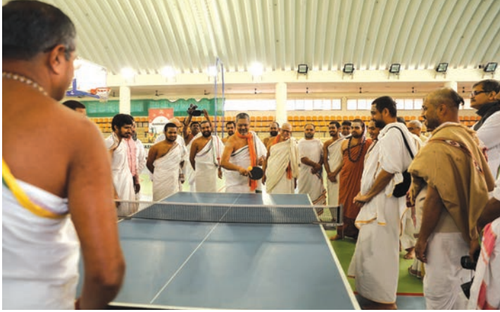
स्वामीजींच्या सेवकांनी टेबल टेनिसचा एक डाव खेळून पाहिला.