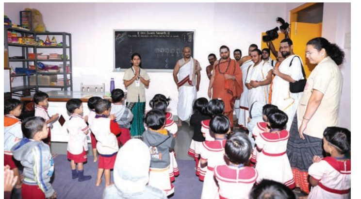
बालवाडी वर्गात श्रीस्वामीजी