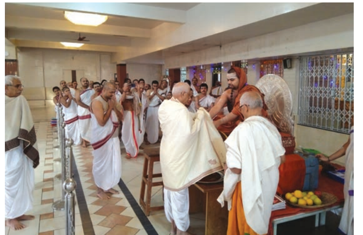
श्रीकाकामहाराजांचा शाल घालून सत्कार करताना श्रीस्वामीजी