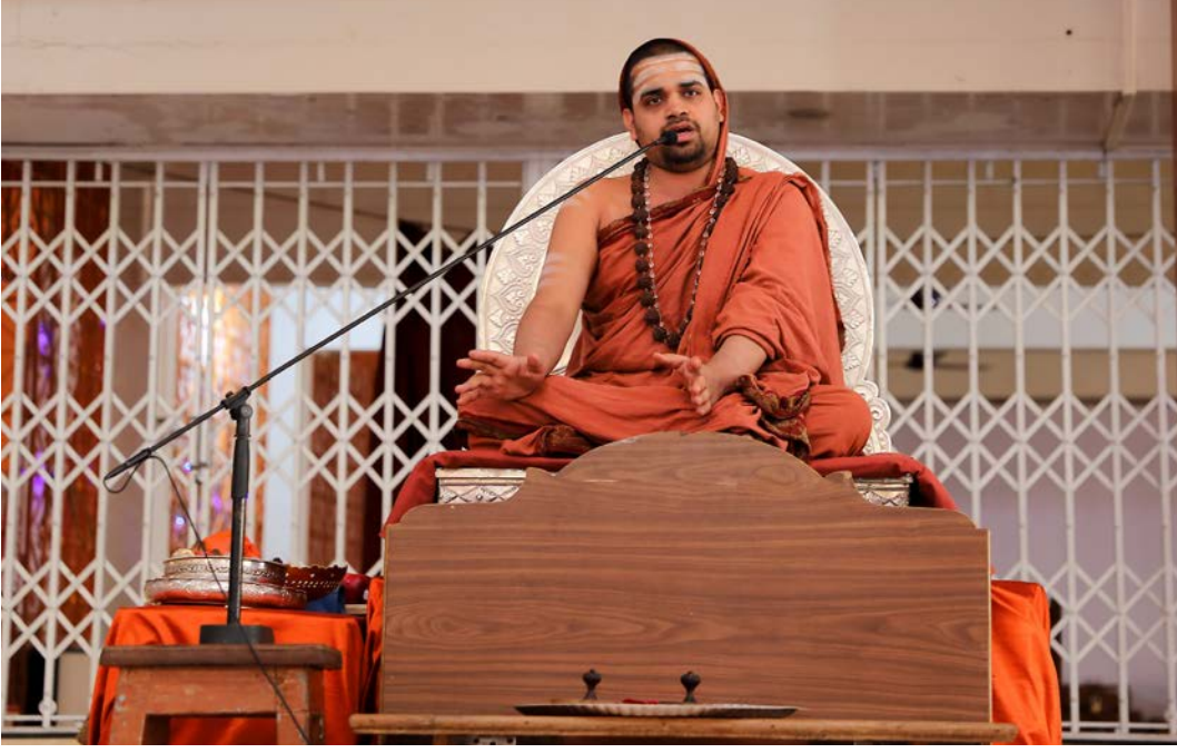
जगद्गुरु श्री विधुशेखर भारती स्वामीमहाराज भक्तगणांना उपदेश करताना

“प्रत्येक माणसाने जीवनात आपल्या अंगी काही चांगल्या गोष्टी बाणवल्या पाहिजेत. त्या शिवाय तो मनुष्य म्हणवून घेण्याला पात्र ठरत नाही. परोपकार ही अशीच एक चांगली गोष्ट आहे जी प्रत्येकाने अंगीकारली पाहिजे. शास्त्रात धर्म म्हणजे काय आणि अधर्म म्हणजे काय याचा बराच विचार आलेला आहे. आणि त्याचा निष्कर्ष असा आहे की ‘परोपकारः पुण्याय । पापाय परपीडनम् ॥’ दुसऱ्यावर उपकार करणे हा धर्म आणि दुसऱ्याला कष्ट, त्रास देणे हा अधर्म. हेच धर्म आणि अधर्माचे स्वरूप आहे. उपकाराचे अनेक प्रकार आहेत. ज्याला जे हवे ते त्याला देणे म्हणजे उपकार. भुकेल्याला अन्न देणे हा उपकार आहे. गरजूला धन देणे हा उपकार आहे. दुसऱ्याला संस्कार प्रदान करणे हाही उपकाराचाच भाग आहे. विद्यादान हाही फारच मोठा उपकार आहे. अनेक प्रकारे उपकार करता येतात. प्रत्येकाने दुसऱ्यावर शक्य तेवढे उपकार करणे आवश्यक आहे. उपकार करणे हे चांगले धर्माचरण आहे.