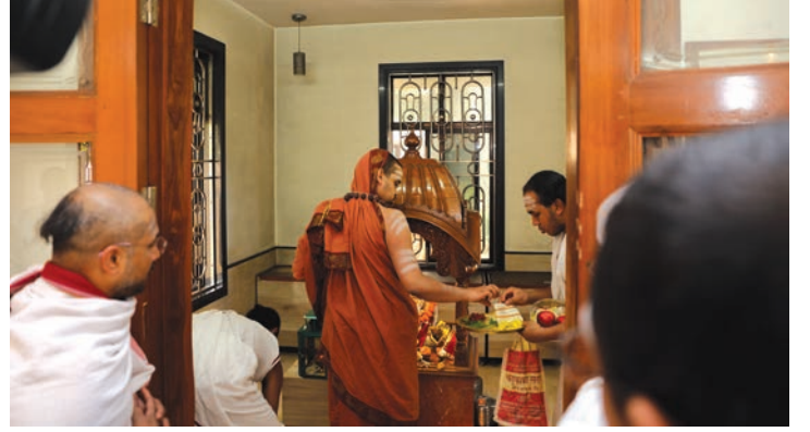
श्रीगणेश मंदिरात स्वामीजी