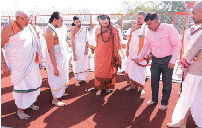
आपल्या सेवकांसमवेत सिंथेटिक ट्रॅकची बारकाईने पाहणी करताना श्रीस्वामीजी