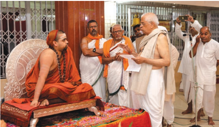
आपल्या गुरूपरंपरेविषयी स्वामीजींना माहिती देताना श्रीकाकामहाराज