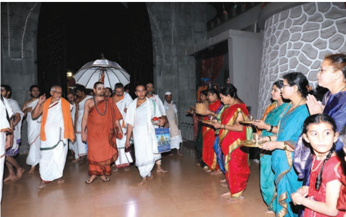
शिव-समर्थगडाच्या प्रवेशद्वारी श्रीस्वामींचे आरती ओवाळून स्वागत