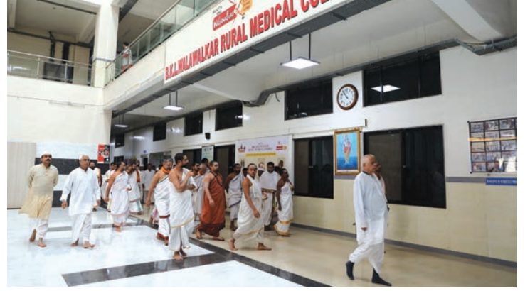
भ.क.ल. वालावलकर मेडिकल कॉलेजमध्ये श्रीकाकांसमवेत पाहणी करताना श्रीस्वामीजी