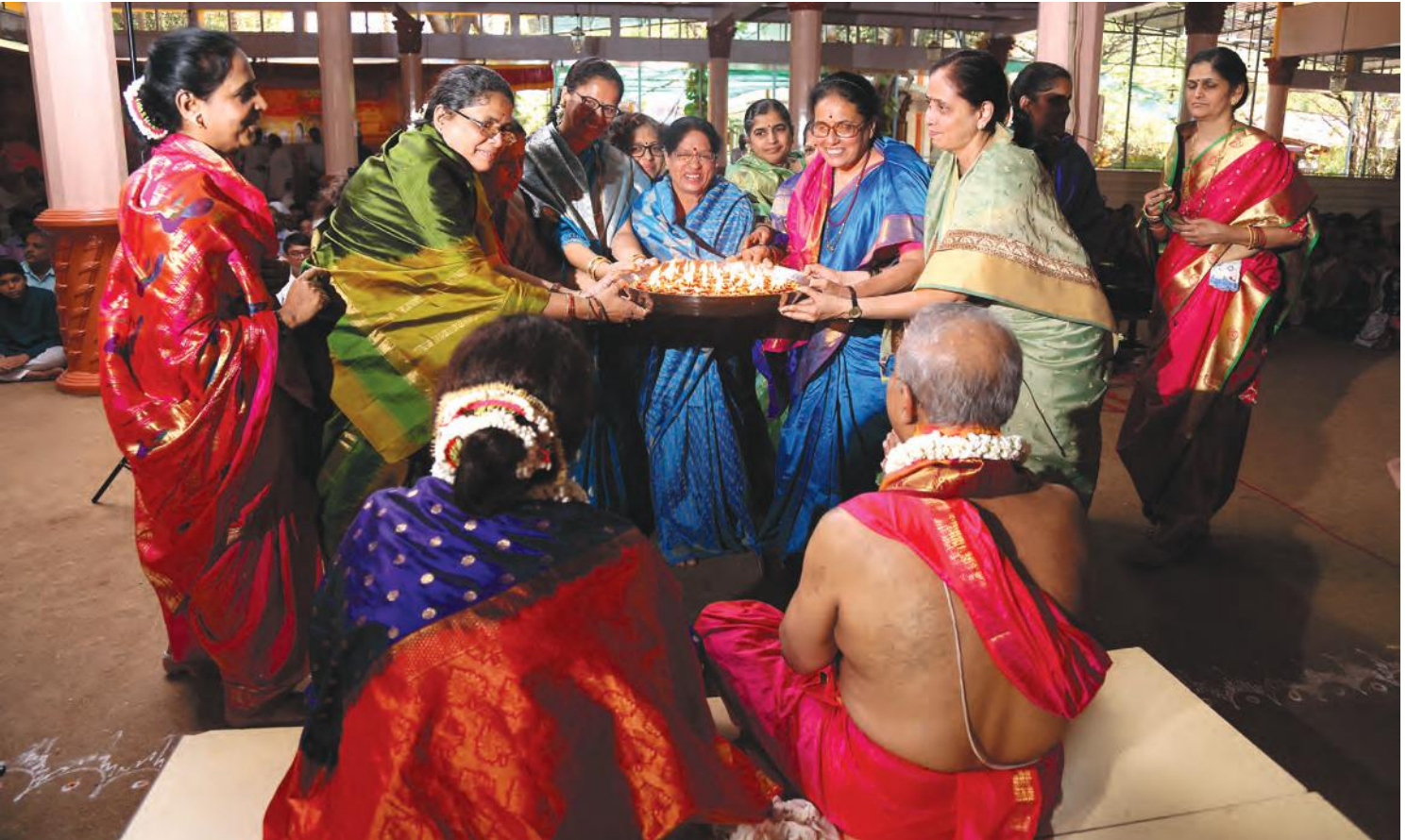
६० दिव्यांनी औक्षण