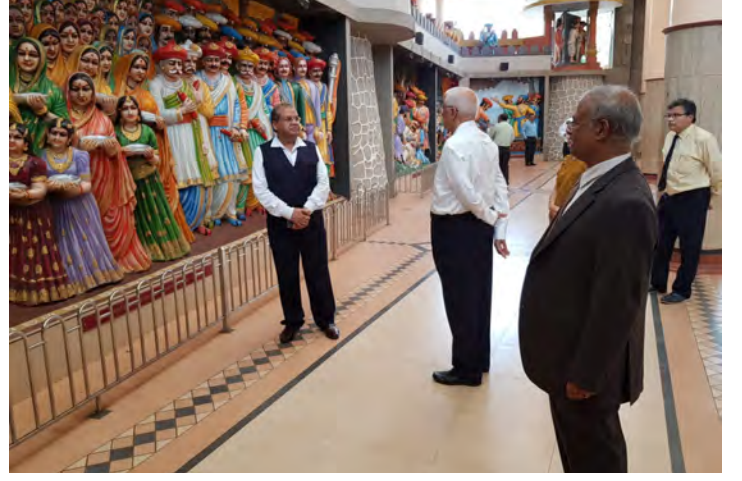
शिवसृष्टी आणि शिवसमर्थ गडाला भेट

वापर करित असतात. हा ब्रिटिश मेडिकल जर्नलचा आकडा आहे. या वर्षीच्या आकडेवारीत २-२ टक्यानी वाढच झाली आहे. काल मी याच विषयावर मुंबई विद्यापीठात ज्येष्ठांच्यासमोर बोललो. आज माझ्यासमोर अनेक तरुण विद्यार्थी आहेत. त्यांना माझे सांगणे आहे की मोबाईलचा वापर जपून करा. ५० टक्क्यांपेक्षा जास्त डिस्चार्ज झालेल्या मोबाईलमधून जास्त रेडिएशन होत असते. येथील