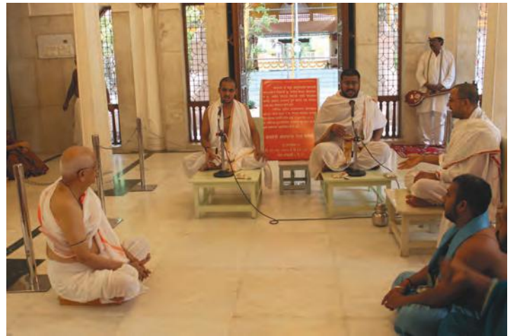
क्रमपारायण श्रवण करताना