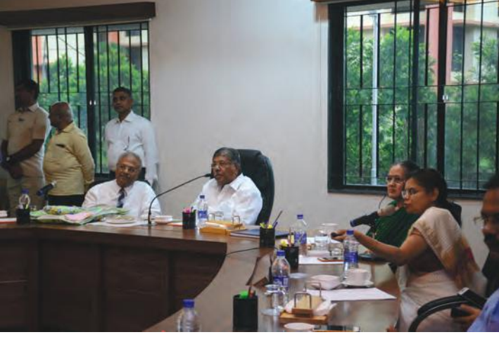
संस्थेच्या कार्याविषयीचे सादरीकरण पाहताना