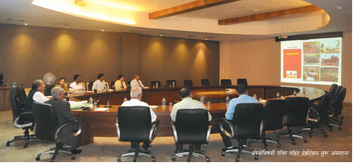
संस्थेविषयी पॉवर पॉइंट प्रेझेंटेशन सुरु असताना

निसर्ग सान्निध्यात एखादे रुग्णालय आणि एखादे महाविद्यालय उभे राहू शकते ही संकल्पना मला खऱ्या अर्थाने माहीत झाली. आज सकाळपासून या कॅम्पसमध्ये फिरताना मला परिपूर्ण पॉझिटिव्ह एनर्जी मिळाली. आपण या महाविद्यालयात शिक्षण घेणारे विद्यार्थी भाग्यवान आहात. मी येथे प्रत्येक विभागात, लायब्ररीत गेलो आणि येथे भारतीय संस्कृतीचे जतन झालेले आहे असे मला माझ्या शाळेच्या दिवसांनंतर जाणवले. मी अनेक महाविद्यालयांना भेटी दिल्या. पण आज येथे मी लो. टिळकांचे आणि स्वातंत्र्यवीर सावरकरांचे स्मारक पाहिले आणि खऱ्या अर्थाने जीवनाचे सार्थक झाले असे मला वाटले. येथे शिकणारे विद्यार्थी येथे होणारे संस्कार जरी सोबत घेऊन गेले तरी भारत हे प्रबळ राष्ट्र झाल्याशिवाय राहणार नाही! सर्व अध्यापक, प्राध्यापक आपल्या परीने येथे सेवा देत आहेत. मी क्रीडासंकुल पाहिले, लायब्ररी पाहिली, स्किललॅब पाहिली.