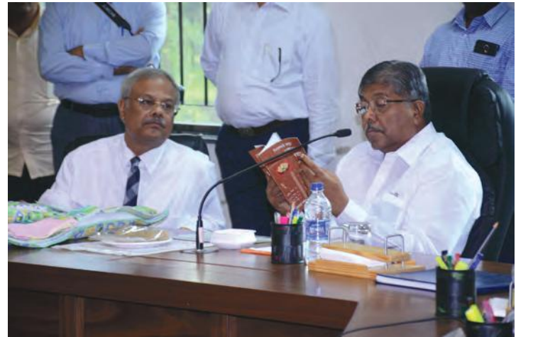
संस्थेच्या पौष्टिक आहार योजनेविषयीची पुस्तिका उत्सुकतेने वाचताना