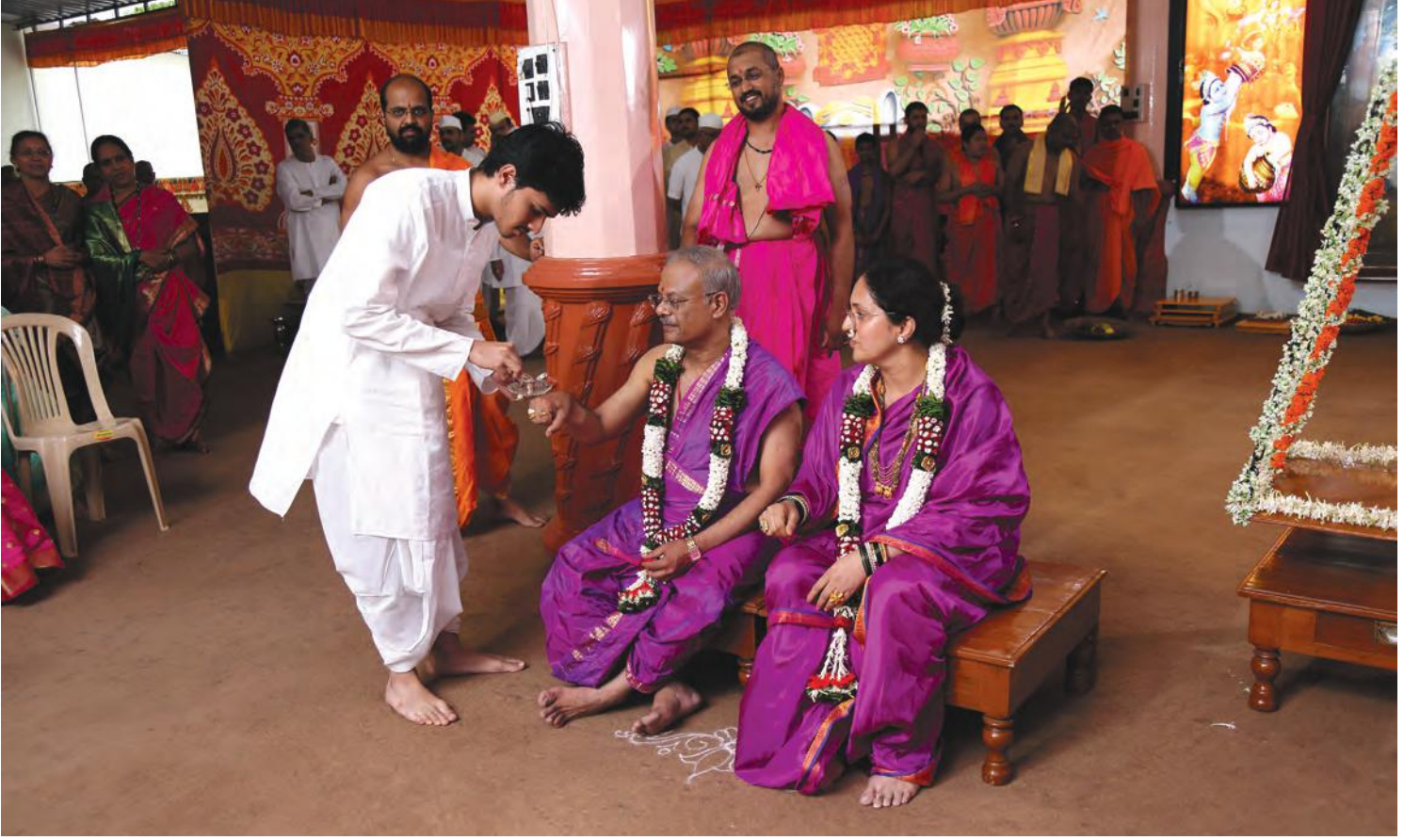
चि. श्रीपतीकडून पितृपूजन