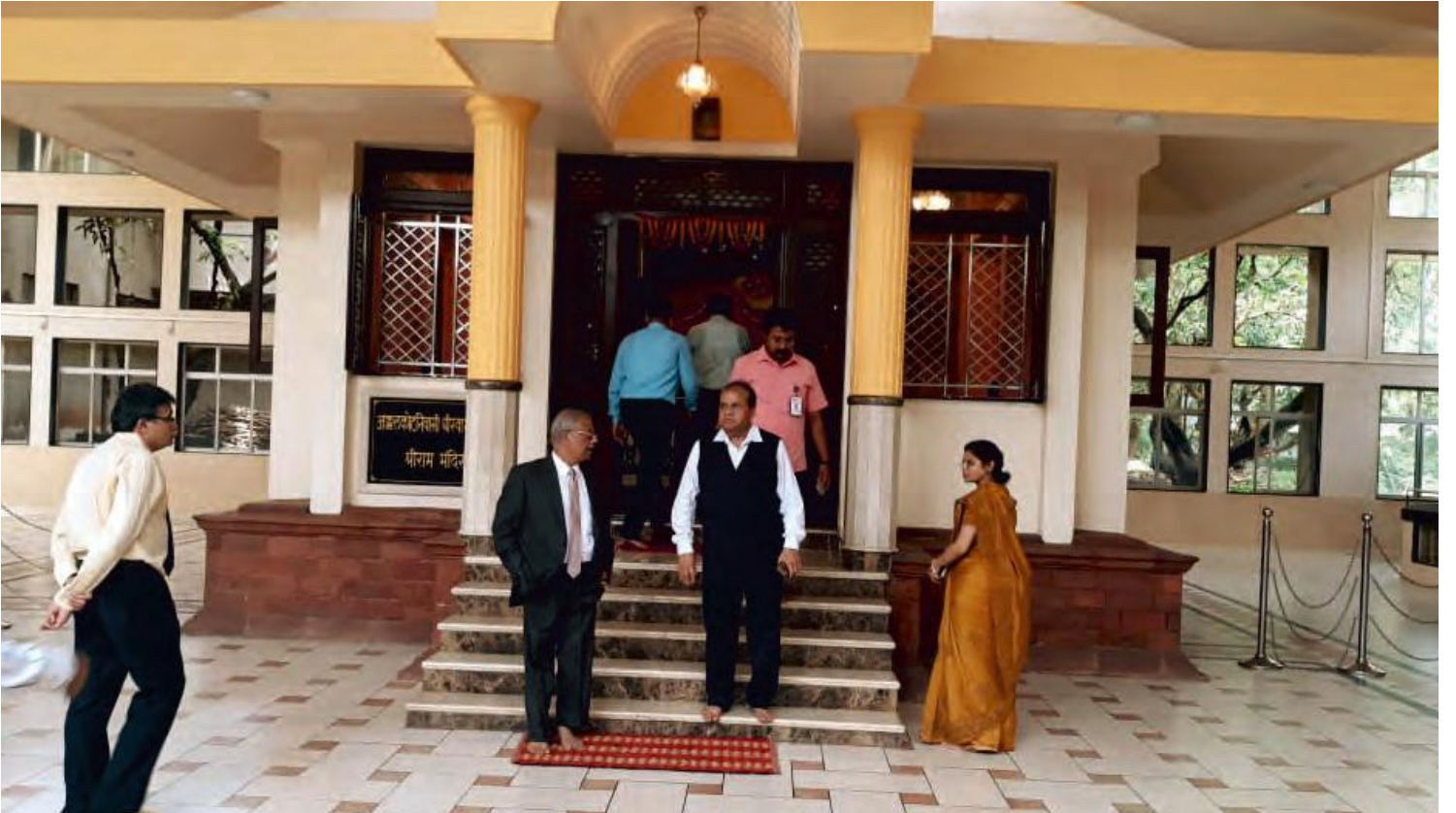
श्रीस्वामी समर्थ- श्रीराममंदिराला भेट