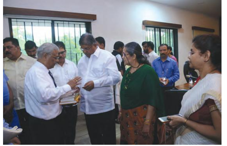
संस्थेची विविध प्रकाशने देताना

तीन आठवडे रुग्णालयात आणून त्यांची प्रसूती सुरक्षित करणाऱ्या रुग्णालयाच्या 'माहेर' योजनेविषयी नामदारांनी विशेष समाधान व्यक्त केले. त्याचप्रमाणे ट्रस्टतर्फे चालविण्यात येणाऱ्या पाठशाळेबद्दलही औत्सुक्य दाखविले.