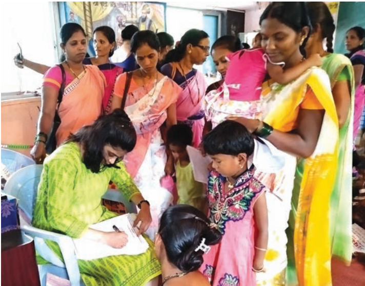
फुणगुस येथील शिबिरात बालकांची आरोग्य तपासणी

आयोजित करण्यात आली होती. या शिबिरांचा एकूण २०० ते २५० लोकांनी लाभ घेतला. या शिबिरात बालरोगतज्ज्ञ डॉक्टरांकडून लहान मुलांची तपासणी करण्यात आली आणि मोफत औषध वाटपही करण्यात आले. तसेच पालकाना तज्ज्ञ डॉक्टरांनी मुलांच्या आरोग्य व आहाराबद्दल मार्गदर्शन केले.