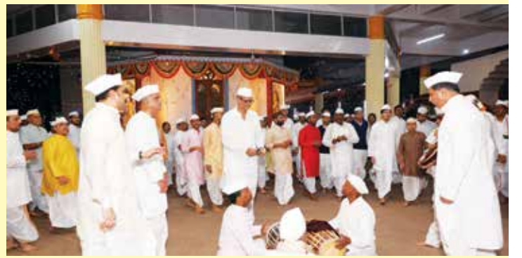
जन्मोत्सव सोहळा : क्षणचित्रे