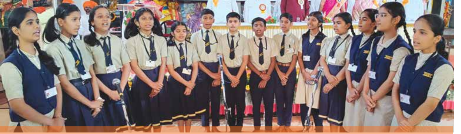
महाराष्ट्र राज्यगीत गाताना इंग्रजी माध्यमाच्या शाळेतील विद्यार्थी

या संशोधनात निघालेला महत्वाचा निष्कर्ष म्हणजे मातेच्या कुपोषणामुळे गर्भात असताना गर्भाचे होणारे चुकीचे (फेटल) प्रोग्रॅमिंग आणि त्यामुळे भविष्यात उद्भवणारे मधुमेहासारखे गंभीर आजार. यावर मात करण्यासाठी पौष्टिक लाडूंबरोबरच मैद्याचा वापर न करता तयार करण्यात आलेली 'मॉर्निंग मिस्ट' ही कॅल्शियम आणि प्रोटीन्सयुक्त बिस्किटे रुग्णालयाने उपलब्ध करून दिली आहेत. यासाठी अनेक संस्था आणि व्यक्तींनी खूप मदत केली आहे.