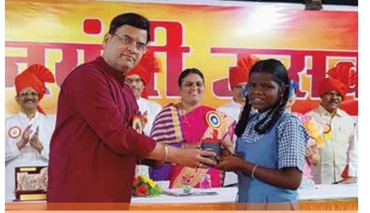
सातवी उत्तीर्ण मुलींना उत्तेजनार्थ मनगटी घड्याळे बक्षीस