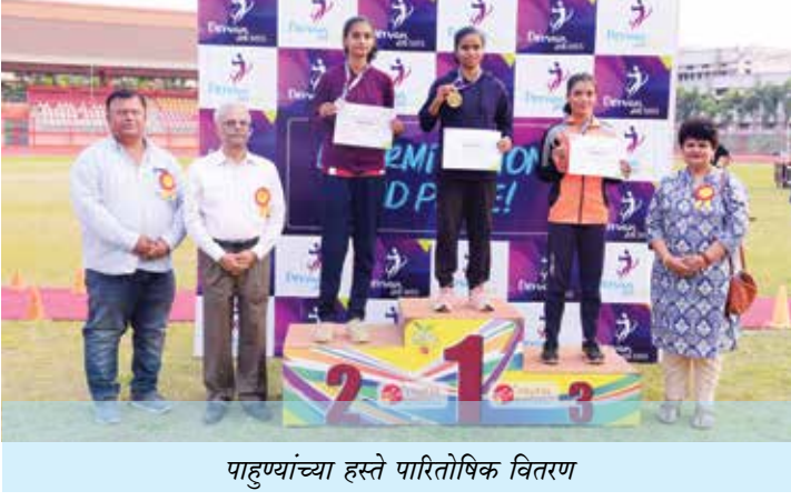
पाहुण्यांच्या हस्ते पारितोषिक वितरण