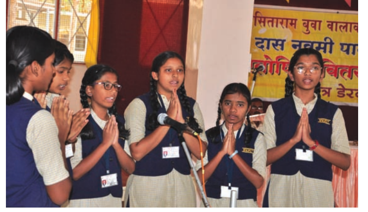
नृसिंह पंचक स्तोत्र पठण - इयत्ता आठवी