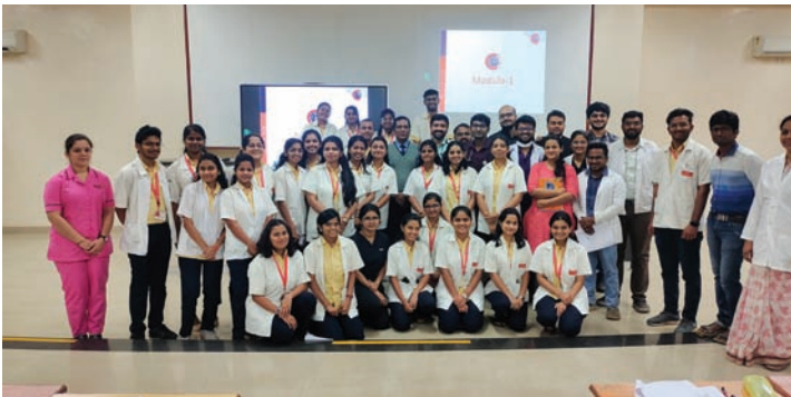
इनर सर्कल प्रोग्रॅममध्ये सहभागी झालेले ज्युनिअर रेसिडेन्ट्स, इंटर्न्स आणि फिजिओथेरेपी विद्यार्थी

इनर सर्कल प्रोग्रॅमची कार्यशाळा दि. १२ फेब्रुवारी २०२३ रोजी भ.क.ल. वालावलकर रुग्णालयातील मेडिकल कॉलजेमध्ये ज्युनिअर रेसिडेन्ट्स, इंटर्न्स, फिजिओथेरेपी विद्यार्थ्यांसाठी घेण्यात आली. इनर सर्कल प्रोग्रॅममध्ये सहानुभूतीने रुग्ण हाताळण्याचे कौशल्य विकसित करणे, रुग्णाबद्दल सहानुभूती आणि संवाद, याविषयी मार्गदर्शन करण्यात आले. ही कार्यशाळा 'डॉ. रेड्डीज लॅबोरेटरीज'द्वारे आयोजित करण्यात आली होती.