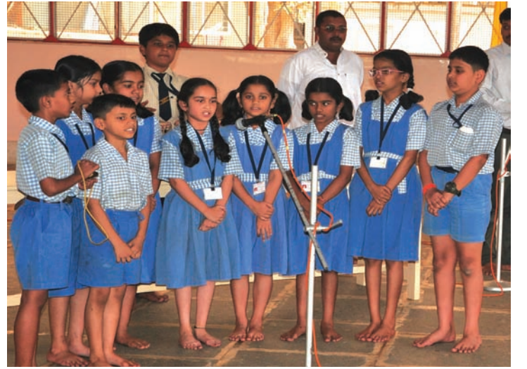
करूणाष्टके पठण - इ. सातवी

सुदृढ असावे लागते. शरीराच्या व्यायामासोबत मनाची मशागत करणेही आवश्यक आहे. आपले मन चंचल असते. चंचल मनाला एकाग्र करण्यासाठी युक्ती, विवेक आणि चातुर्य यांचा वापर करावा. या गुणांचा अवलंब करून आपण स्वतःचे, स्वतःच्या