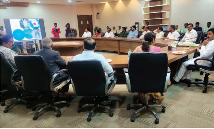
मा. ना. श्री. अजयकुमार मिश्रा वालावलकर ग्रामीण वैद्यकीय महाविद्यालयात