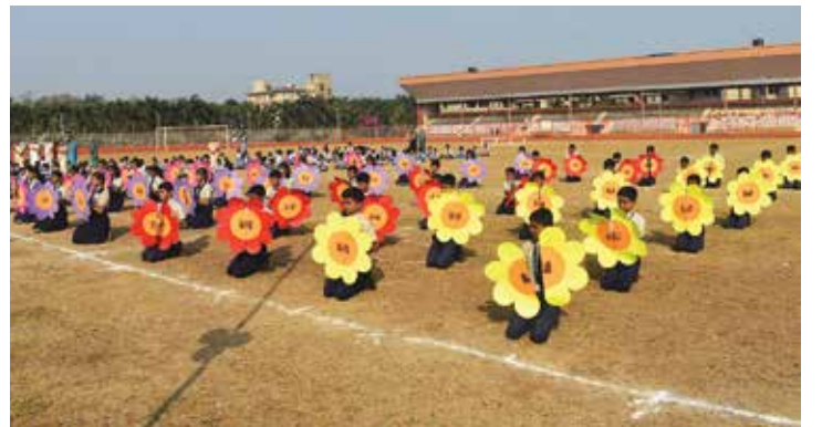
प्राथमिक शाळेतील मुले ‘फ्लॉवर ड्रिल’ सादर करताना