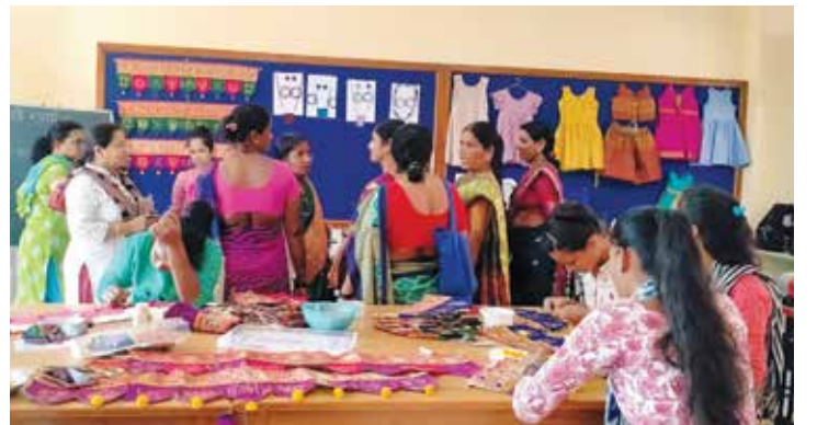
ट्रस्टच्या कौशल्य विकास केंद्रातून व्यवसायाभिमुख उपक्रमांची माहिती घेताना