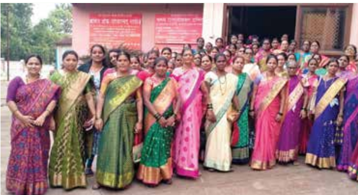
बचत गट मेळाव्या साठी उपस्थित महिला