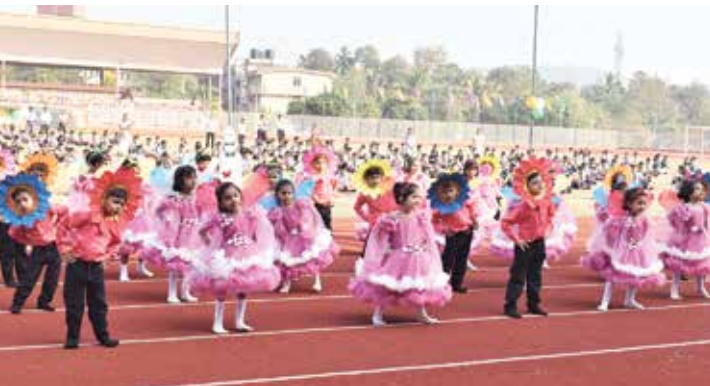
ज्युनिअर के.जी.तील मुले ‘बटरफ्लाय डान्स’ करत बागडताना

कार्यक्रमाचे सूत्रसंचालन इयत्ता अकरावीच्या विद्यार्थ्यांनी केले.