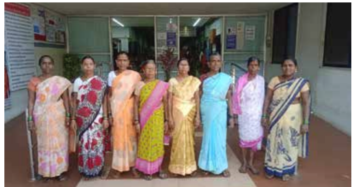
भ.क.ल.वालावलकर रुग्णालयात काम करणाऱ्या स्थानिक स्त्री-कामगार