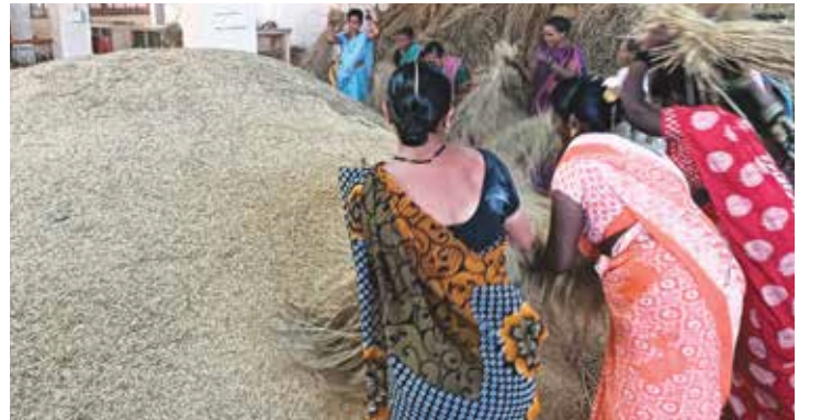
संस्थेच्या शेतातील भातझोडणी