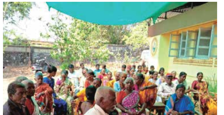
मोफत आरोग्य शिबिर