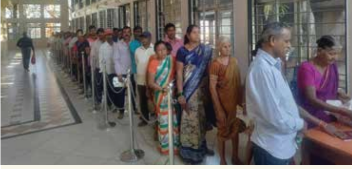
गणपतीसणानिमित्त तेल, साखर वाटप