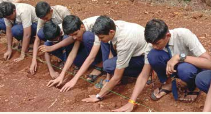
कंदलागवड करताना प्रशालेतील विद्यार्थी