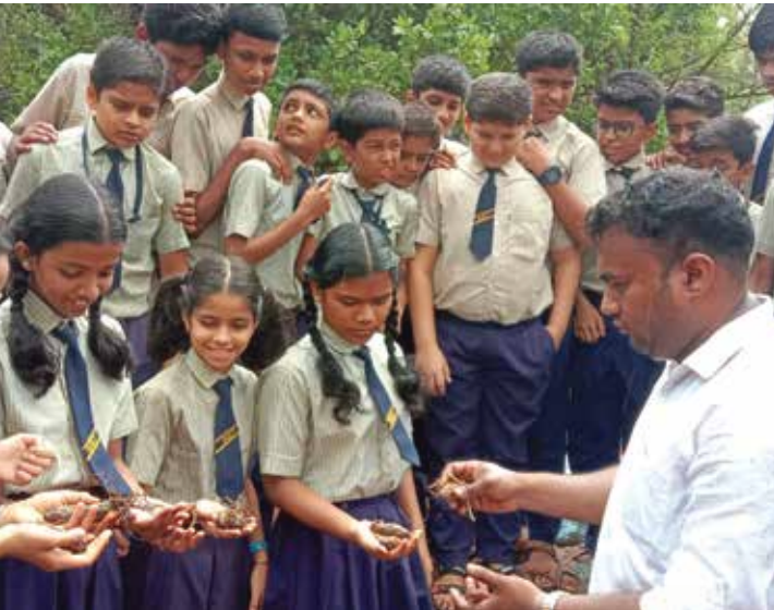
कंद लागवड करताना प्रशालेतील विद्यार्थी