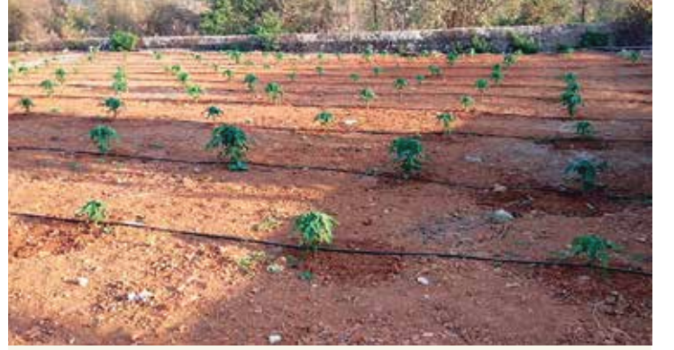
संस्थेची पपई लागवड

* ट्रस्टच्या शेतजमिनीमध्ये सेन्द्रिय खतांचा वापर करून पिकवलेल्या फळभाज्या, पालेभाज्या तसेच कुळीथ, चवळी, पावटा अशी कडधान्ये आणि आंबा, फणस, काजू, चिकू, पपई, कलिंगड, केळी, जांभूळ अशी विविध प्रकारची फळे लोकांना स्वस्त दरात देण्यात आली. एकूण विक्री - रु. २,२०,४४५/-