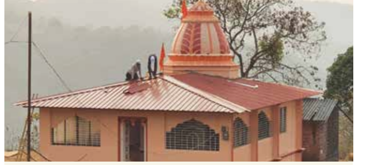
वाघजाई मंदिर, पाचांबे