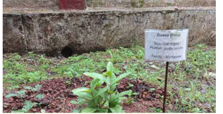
विद्यार्थ्यांनी केलेले वृक्षारोपण

श्री विठ्ठलराव जोशी चॅरिटीज ट्रस्ट इंग्लिश मिडियम स्कूल अँड ज्युनियर कॉलेज ऑफ सायन्स, सावर्डे प्रशालेत दि. ५ जून रोजी 'पर्यावरण दिन' उत्साहात पार पडला. यानिमित्ताने वृक्षारोपण व कंदमूळ लागवड असे दोन उपक्रम घेण्यात आले. शाळेच्या परिसरातच इयत्ता नववीच्या विद्यार्थ्यांनी पपई, पेरू, बदाम, कोकम, सोनचाफा, बेल या रोपांची लागवड केली. रोपं नुसती लावून चालत नाहीत तर ती मायेने जगवावी लागतात, हे कळावे म्हणून ह्या रोपांच्या संगोपनाची जबाबदारीही याच विद्यार्थ्यांवर सुपूर्द करण्यात आली आहे.