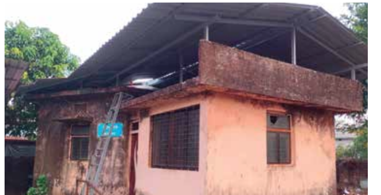
जि.प. शाळा क्र. १, डेरवण - पन्चाची शेड