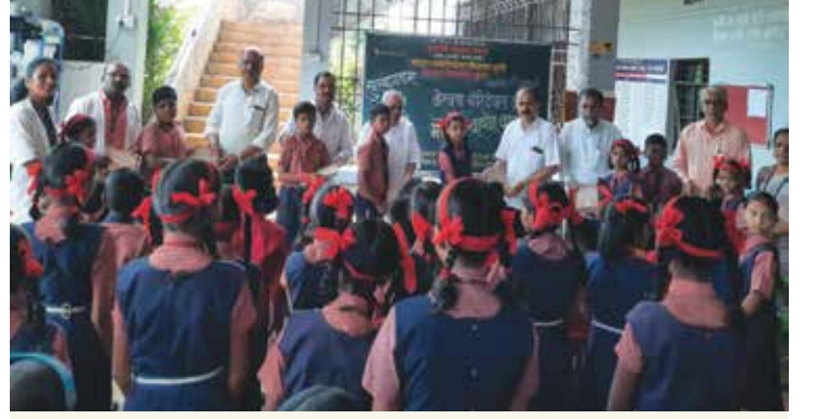
सदुरू श्रीकाडसिद्धेश्वर विद्यालय, गुणदे