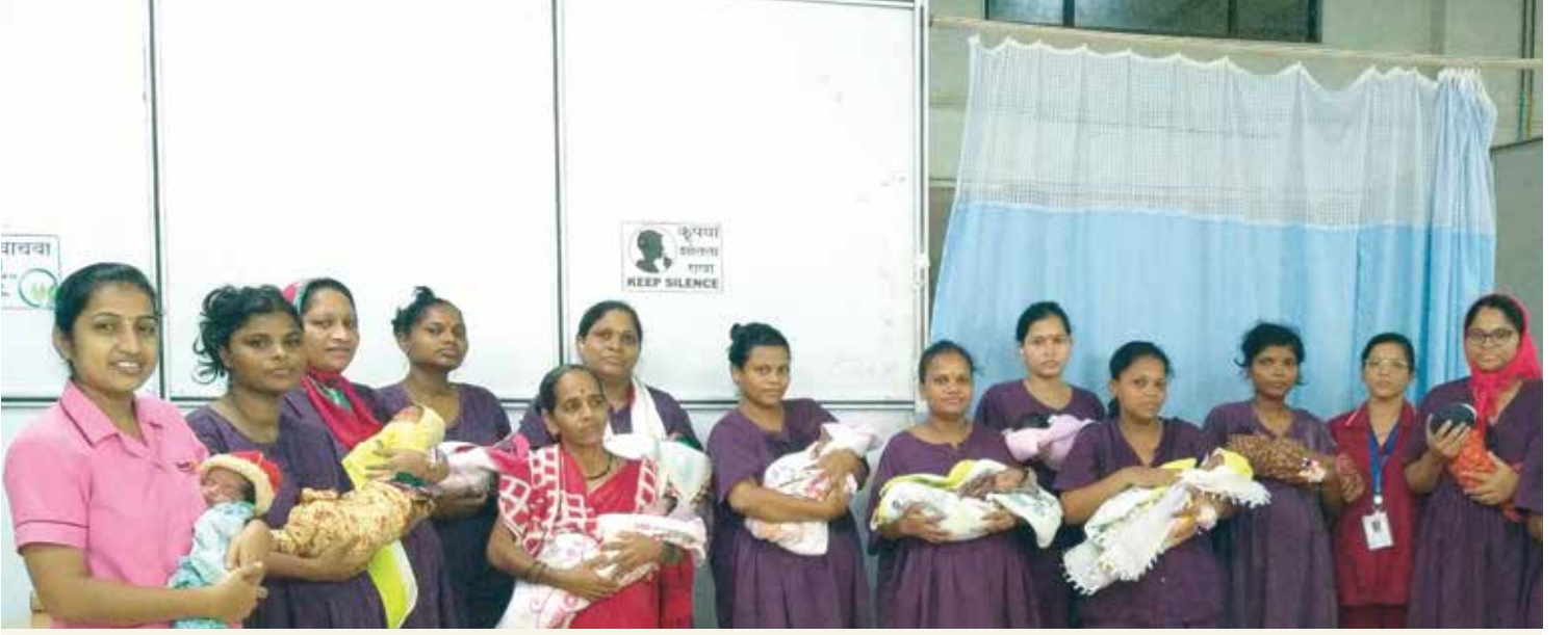
रुग्णालयातील सामुदायिक बारसे सोहळा

५. जनरल हेल्थ चेक-अप या अंतर्गत गावागावात जाऊन सर्व वयातील लोकांची प्राथमिक तपासणी केली जाते. ई.सी.जी, मधुमेह, डोळ्यांची तपासणी अशा तपासण्या करून त्यातून ज्या रुग्णांना काही शस्त्रक्रिया किंवा अन्य काही वेगळ्या तपासण्या करायच्या आहेत, त्यासाठी शिबिरांचे आयोजन करून रुग्णांवर उपचार केले जातात. मोतीबिंदू शस्त्रक्रिया, हाडांवरील शस्त्रक्रिया, वेगवेगळ्या आजारांवर होणाऱ्या शस्त्रक्रिया ह्या अत्यल्पदरात किंवा पूर्णतः मोफत केल्या जातात.