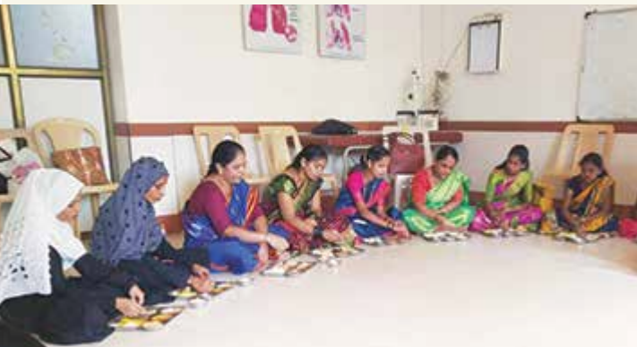
गर्भवती स्त्रियांना पौष्टिक आहार