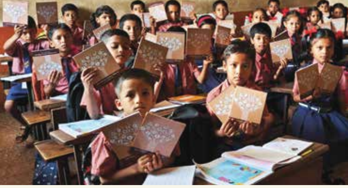
गुणदे, खेड येथील शाळेत मोफत १०० पानी वह्यांचे वाटप