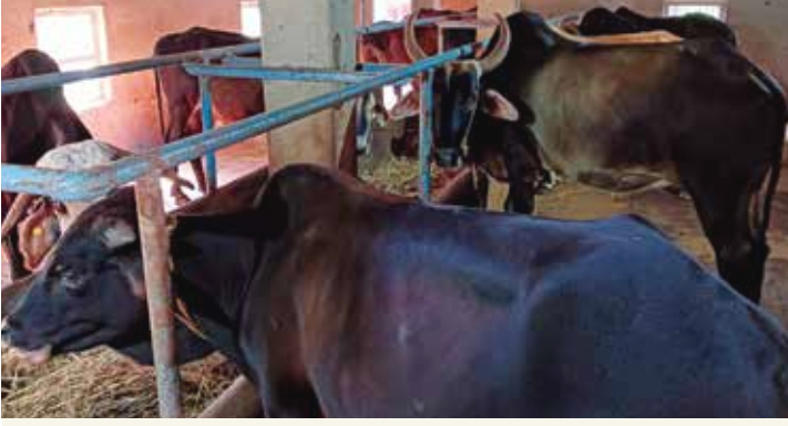
संस्थेच्या मालकीचे गोधन