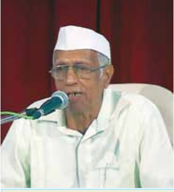
डॉ. शरदराव राजगुरू