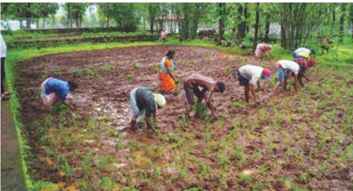
संस्थेच्या शेतातील भात लावणी

पेंढा आणि गवत खरेदीचा एकूण खर्च - रु. ५,४५,७५९/-