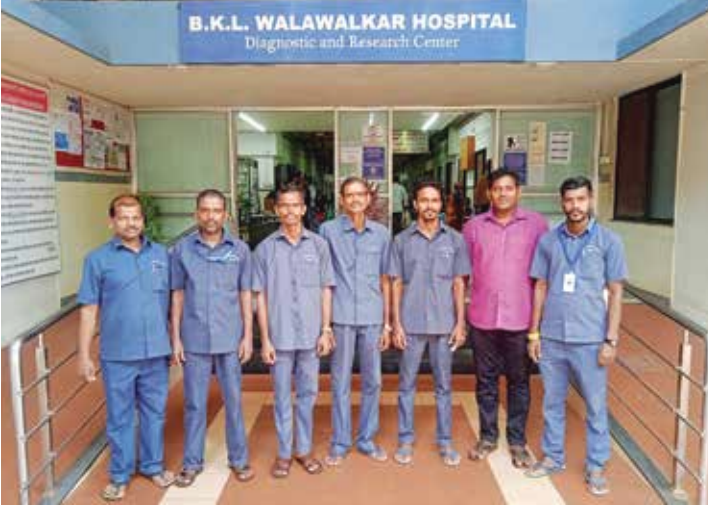
भ.क.ल.वालावलकर रुग्णालयात काम करणारे स्थानिक कामगार