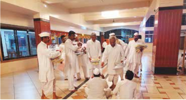
शिवजयंतीनिमित्त शर्ट वाटप