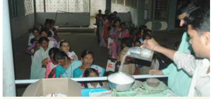
श्रावणमासानिमित्त तेल, साखर वाटप

दि. १ एप्रिल २०२३ ते ३१ मार्च २०२४ या कालावधीत ट्रस्टच्या ७५० ओळखपत्रधारक कुटुंबांना खालील सणानिमित्त सवलतीच्या दरामध्ये तेल, साखर यांचे वाटप