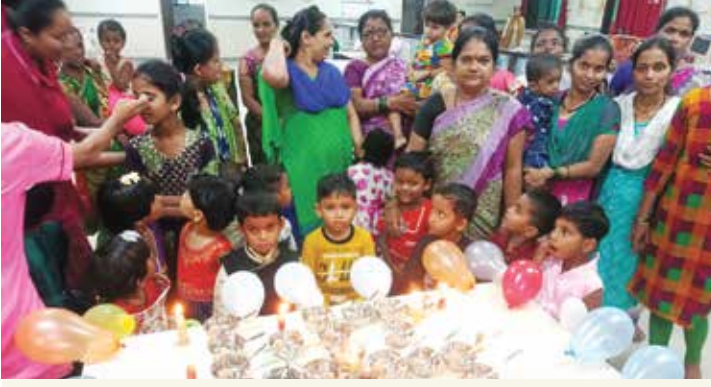
सामुदायिक वाढदिवस सोहळा

भ.क.ल. वालावलकर रुग्णालय, रोगनिदान व संशोधन केंद्र गेल्या २५ वर्षांपासून समाजातील आबालवृद्धांपर्यंत वेगवेगळ्या उपक्रमातून पोहोचत असते. त्यामध्ये ० ते ६ वयोगटातील मुलांसाठी वालावलकर सुदामा योजना, वालावलकर लड्डूगोपाल योजना राबविल्या जातात. त्यात रुग्णालयात मुलांचे सामुदायिक वाढदिवस साजरे करणे, आरोग्य तपासण्या, निवासी शिबिरे, लाडू वाटप आदी उपक्रम केले जातात.