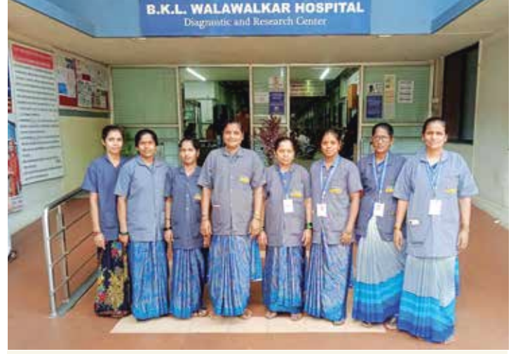
भ.क.ल.वालावलकर रुग्णालयात काम करणाऱ्या स्थानिक स्त्रिया