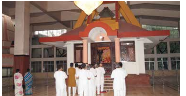
श्रीस्वामी समर्थ-श्रीराममंदिर, श्रीक्षेत्र डेरवण