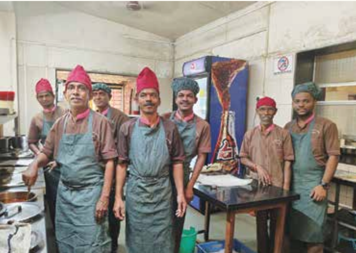
भ.क.ल.वालावलकर रुग्णालयाच्या उपाहारगृहात काम करणारे स्थानिक कामगार