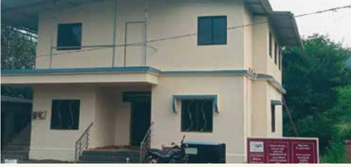
डेरवण ग्रामपंचायत इमारत