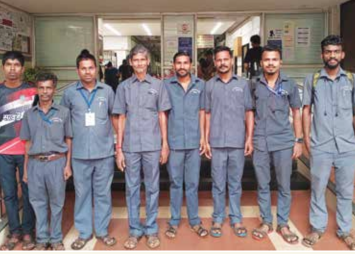
भ.क.ल.वालावलकर रुग्णालयात काम करणारे स्थानिक कामगार