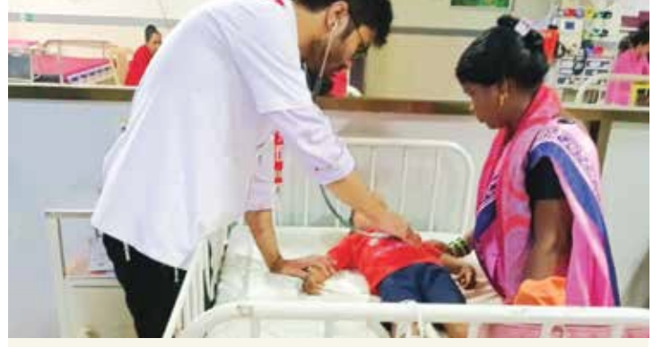
सुदामा योजनेअंतर्गत बालकांची रुग्णालयात आणून आरोग्य तपासणी

दिवसाची कार्यशाळा व ३ ते ५ दिवसांच्या निवासी शिबिरासाठी रुग्णालयात आणले जाते आणि या शिबिरासाठी साधारण २५ ते ३० मुलींना आणले जाते रुग्णालयात आणल्यावर त्यांच्या सर्व तपासण्या - डोळे, नाक, कान, घसा, दंतचिकित्सा, रक्ताची तपासणी इ. स्त्रीरोगतज्ज्ञ करतात. मोटीवेशनल मूव्ही, आपल्याकडे असलेल्या विविध खेळाचे विभाग दाखवले जातात. करिअर गाइडन्स, रोज सकाळी योगासने, विविध सांस्कृतिक कार्यक्रम इत्यादी उपक्रम राबविले जातात. संपूर्ण दिवस वेगवेगळ्या माध्यमातून त्यांचा शारीरिक व मानसिक विकास होईल यावर जास्तीत जास्त भर दिला जातो. शिबिरात आलेल्या सुरुवातीला लाजणाऱ्या मुली शेवटच्या दिवशी जेव्हा त्यांचं मनोगत व्यक्त करतात त्या वेळी त्यांच्यामध्ये आलेला आत्मविश्वास हा एक चांगला अनुभव असतो. पुढील आयुष्यात कोणते शिक्षण घ्यायचे, आपलं करिअर कसं घडेल इथपर्यंत निर्णय घेण्याची तयारी झालेली असते. जून आणि ऑगस्ट महिन्यात २ निवासी शिबिरे झाली. त्यात लांजा तालुक्यातील २४ मुली, दहिवली गावातील २९ मुली आणि त्यांच्या पालकांनी भाग घेतला.