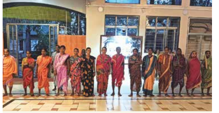
श्रीसंत सीतारामबुवा वालावलकर ट्रस्टमध्ये काम करणाऱ्या स्थानिक कामगार स्त्रिया

कोकणातील बहुतांश शेतकरी आपल्या शेतातून कुटुंबाच्या निर्वाहाएवढे उत्पन्न काढू शकत नाहीत. अशा शेतकऱ्यांना आणि भूमिहीन शेतमजुरांना (स्त्री-पुरुष) वर्षभर रोजगार मिळावा आणि तो कर्जाच्या विळख्यात सापडू नये या उद्देशाने ट्रस्टने श्रीमहाराजांची ही महत्वाकांक्षी योजना सुरू ठेवली आहे. या योजनेचा लाभ घेणारे बहुतांश शेतीव्यवसायातील असल्याने त्यांना मुख्यत्वेकरून ट्रस्टच्या शेतांवरच काम दिले जाते. त्याचबरोबर आता संस्थेचे रुग्णालय, वैद्यकीय महाविद्यालय, नर्सिंग कॉलेज, पॅरामेडिकल कोर्सेस, कौशल्य प्रशिक्षण वर्ग, शाळा, क्रीडासंकुल आदी उपक्रमात सुमारे १०३८ स्त्री-पुरुष कार्यरत आहेत. यामध्ये प्रामुख्याने १०२ अध्यापक, ४६६ विविध कौशल्यप्राप्त आरोग्य कर्मचारी (परिचारिकांसह) आणि ४७० अकुशल कर्मचाऱ्यांचा समावेश आहे.