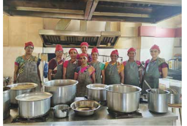
भ.क.ल.वालावलकर रुग्णालयाच्या उपाहारगृहात काम करणाऱ्या स्थानिक स्त्रिया