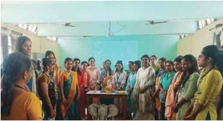
देवसुखच्या कॉलेजमध्ये भोंडला