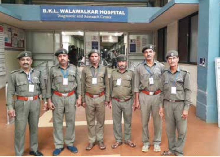
भ.क.ल.वालावलकर रुग्णालयात काम करणारे सुरक्षारक्षक