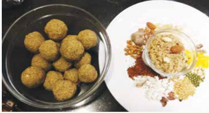
पौष्टिक लाडू आणि त्याचे घटक पदार्थ

भ.क.ल. वालावलकर रुग्णालय, रोगनिदान व संशोधन केंद्र गेल्या २५ वर्षांपासून समाजातील आबालवृद्धांपर्यंत वेगवेगळ्या उपक्रमातून पोहोचत असते. त्यामध्ये ० ते ६ वयोगटातील मुलांसाठी वालावलकर सुदामा योजना, वालावलकर लड्डूगोपाल योजना राबविल्या जातात. त्यात रुग्णालयात मुलांचे सामुदायिक वाढदिवस साजरे करणे, आरोग्य तपासण्या, निवासी शिबिरे, लाडू वाटप आदी उपक्रम केले जातात.