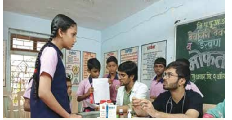
किशोरवयीन मुलींची आरोग्य तपासणी