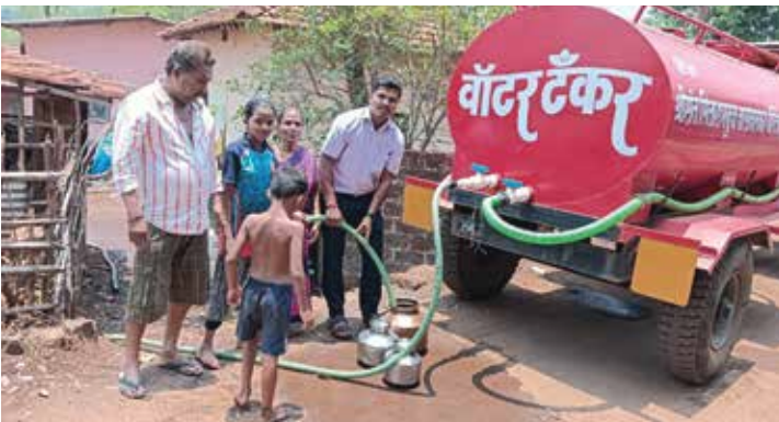
मारुतीची चव्हाणवाडी येथे टॅन्करद्वारे मोफत पाणीपुरवठा