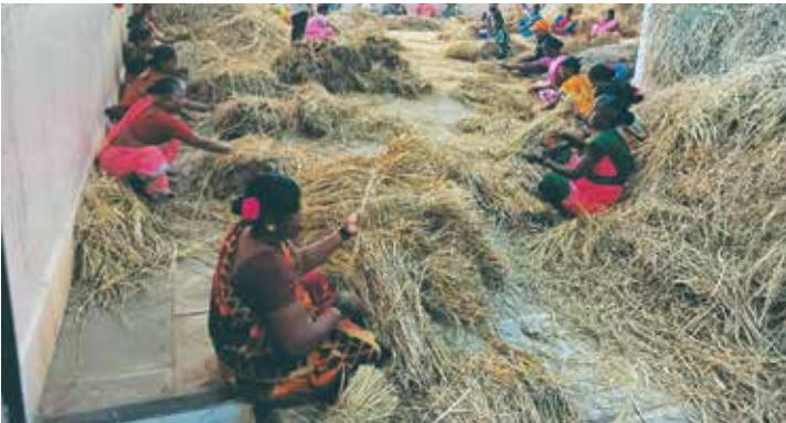
संस्थेच्या शेतातील भाताच्या पेंढ्या बांधणे