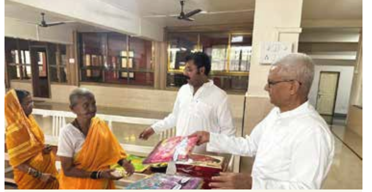
दिवाळीनिमित्त साडी वाटप

श्रीसंत सीतारामबुवा वालावलकर चॅरिटेबल ट्रस्टतर्फे विविध सण आणि उत्सवांच्या निमित्ताने परिसरातील ग्रामस्थ स्त्री-पुरुषांना साड्या आणि शर्ट यांचे विनामूल्य वाटप करण्यात येते. त्यामुळे त्यांच्यावर येणारा प्रपंचाचा वार्षिक खर्चाचा भार हलका होतो.