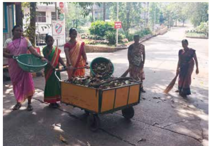
भ.क.ल.वालावलकर रुग्णालयात काम करणाऱ्या स्थानिक स्त्रिया