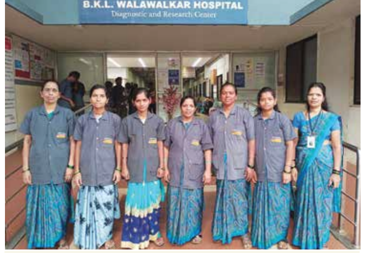
भ.क.ल.वालावलकर रुग्णालयात काम करणाऱ्या स्थानिक स्त्रिया