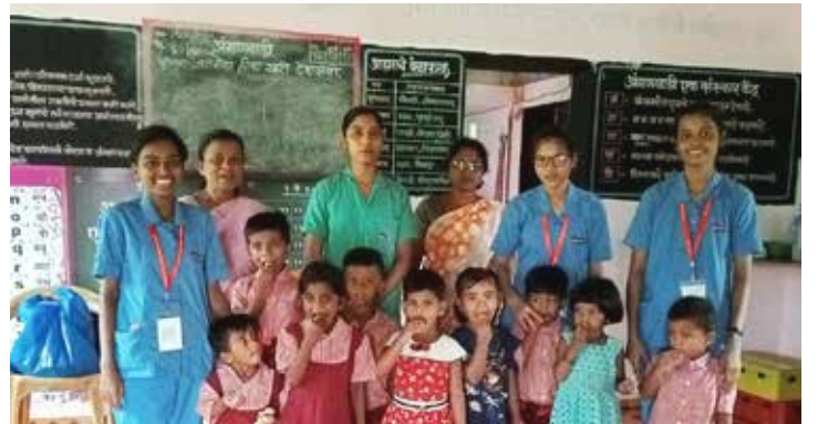
कुपोषित मुलांसाठी पौष्टिक लाडू वाटप

३. सुकन्या योजने अंतर्गत किशोरवयीन मुलींची शाळेमधून हिमोग्लोबिनची तपासणी केली जाते. मार्गदर्शन केले जाते, १