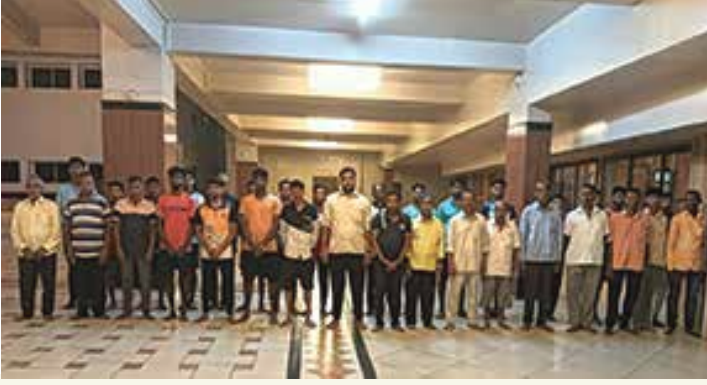
श्रीसंत सीतारामबुवा वालावलकर ट्रस्टमध्ये काम करणारे स्थानिक कामगार