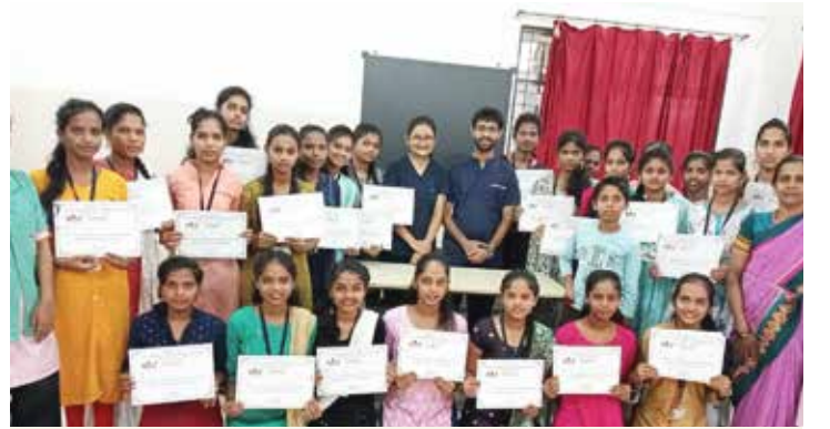
किशोरवयीन मुलींना शिबिरात सहभागी झाल्यावर देण्यात येणारे प्रमाणपत्र