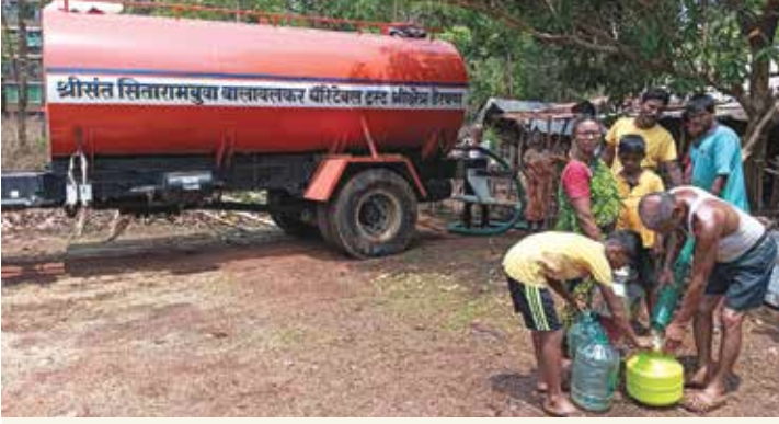
सावर्डे बौद्धवाडी येथे टॅन्करद्वारे मोफत पाणीपुरवठा