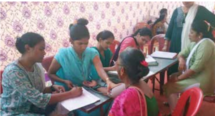
मोफत आरोग्य शिबिर