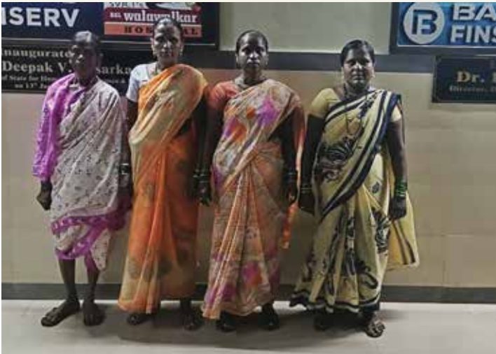
भ.क.ल.वालावलकर रुग्णालयात काम करणाऱ्या स्थानिक स्त्रिया