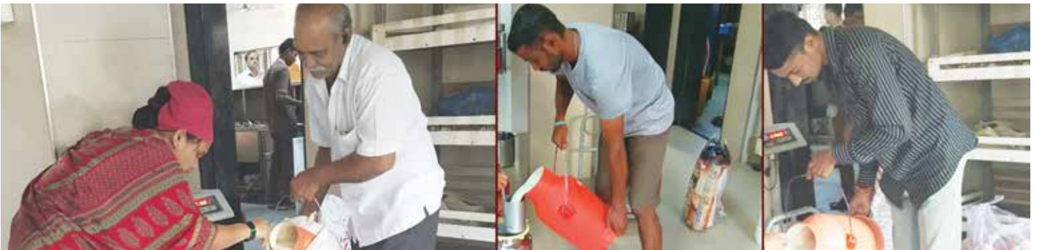
भ.क.ल.वालावलकर रुग्णालयाच्या उपाहारगृहात स्थानिक शेतकऱ्यांकडून दूध खरेदी केले जाते

शेतकऱ्यांकडून केलेल्या गाई-म्हशींच्या दूध खरेदीचा एकूण खर्च - रु. १९,७२,०९०/-