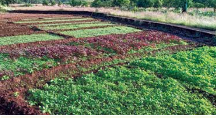
संस्थेची भाजीपाला लागवड

* ट्रस्टच्या शेतजमिनीमध्ये सेन्द्रिय खतांचा वापर करून पिकवलेला १०६६ किलो तांदूळ लोकांना स्वस्त दरात देण्यात आला. १०६६ कि. X ३३ रु. प्रतिकिलो