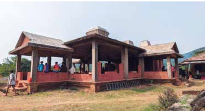
केदारनाथ मंदिर, डेरवण