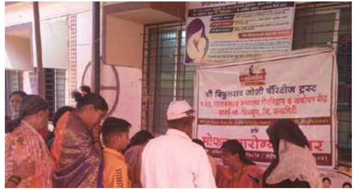
मोफत आरोग्य शिबिर

कुकावने गावात जुलै महिन्यात १००, ऑगस्टमध्ये १८५ तर सप्टेंबरमध्ये पुरये गावात ४६, वीर गावात ११७ अशा एकूण १६३ रुग्णांनी लाभ घेतला.