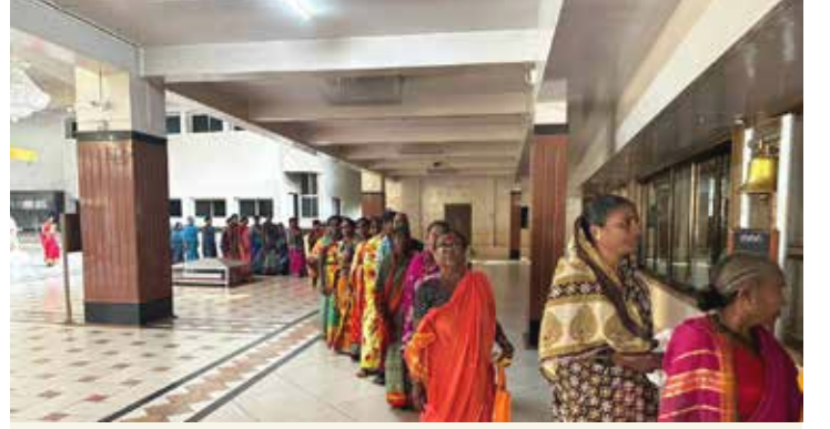
साडीवाटपाला महिलांचा मिळणारा उत्साही प्रतिसाद