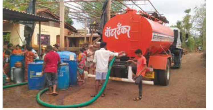
गणेशवाडी, डेरवण येथे टॅन्करद्वारे मोफत पाणीपुरवठा

पंचक्रोशीतील पाण्याची समस्या लक्षात घेऊन ट्रस्टर्फे, ट्रस्टच्या मालकीच्या तसेच भाड्याने आणलेल्या टॅन्कर्सद्वारे टंचाईच्या काळात दररोज १,५०,००० लिटर पाणी आंबतखोल, दहिवली, बहादूरशेख नाका, खेडी येथून उचलून खालील गावांना पुरविण्यात आले.