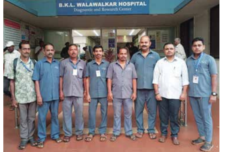
भ.क.ल.वालावलकर रुग्णालयात काम करणारे स्थानिक कामगार