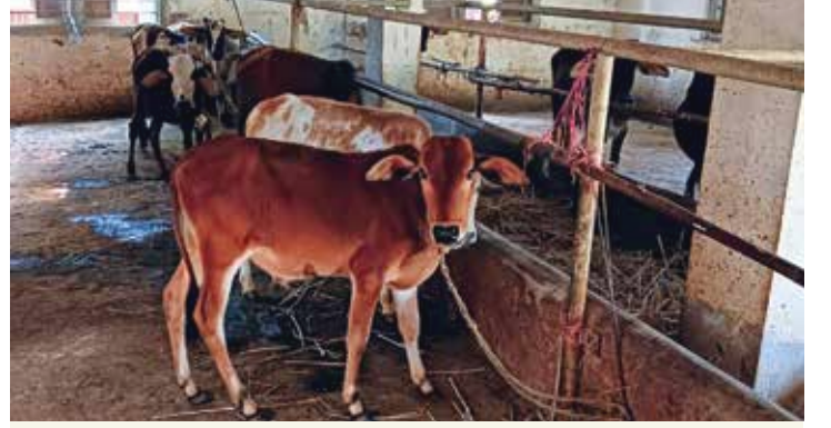
संस्थेच्या मालकीचे गोधन