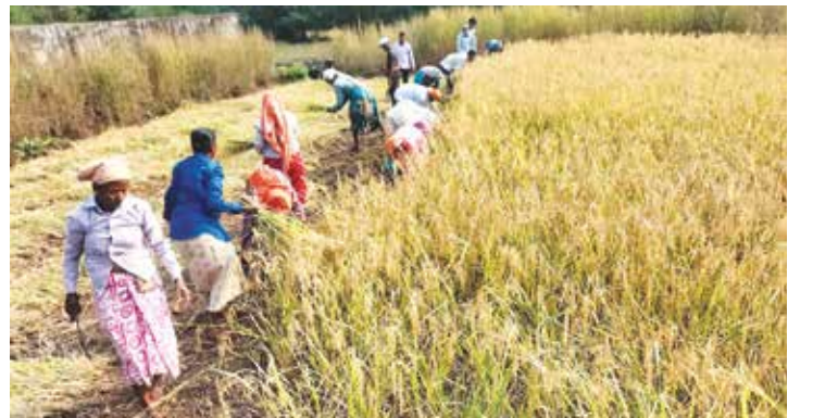
संस्थेच्या शेतातील भात कापणी