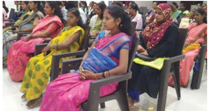
गर्भवती स्त्रियांना आरोग्यविषयक मार्गदर्शन