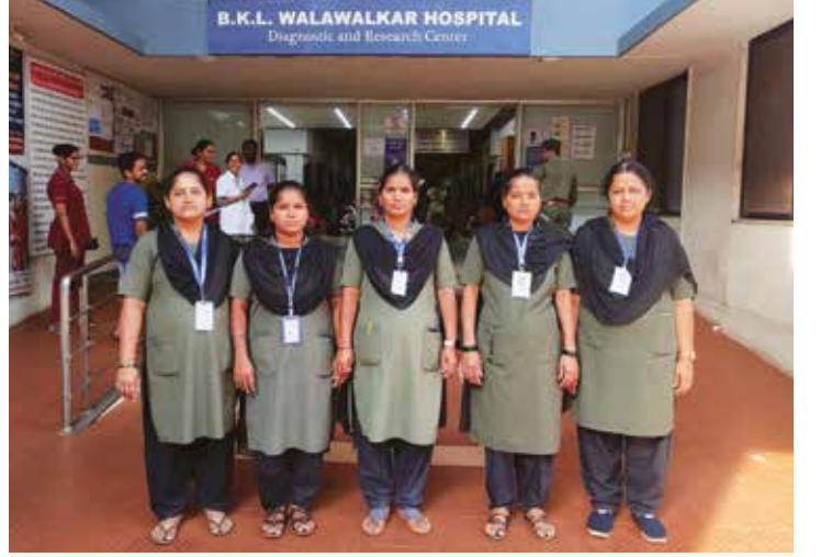
भ.क.ल.वालावलकर रुग्णालयात काम करणाऱ्या सुरक्षारक्षक स्थानिक स्त्रिया