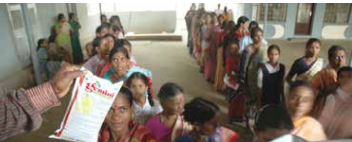
दिवाळीनिमित्त तेल, साखर वाटप

दि. १ एप्रिल २०२३ ते ३१ मार्च २०२४ या कालावधीत ट्रस्टने तेल-साखर वाटपासाठी केलेला खर्च : रु. ६,३१,२६०/- तेल-साखर विक्रीतून जमा झालेली रक्कम : रु. ४,६५,०००/- ट्रस्टने लोकांना केलेली मदत : रु. १,६६,२६०/-