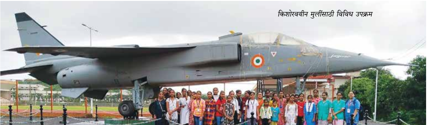
किशोरवयीन मुलींसाठी विविध उपक्रम

४. यशोदा योजने अंतर्गत गावागावात जाऊन गरोदर मातांची तपासणी केली जाते. वजन, उच्च रक्तदाब तपासला जातो आणि पौष्टिक लाडू देण्यात येतात. दर महिन्याला रुग्णालयात आणून डोहाळेजेवण, स्त्रीरोग तज्ज्ञांकडून तपासणी, मार्गदर्शन दिले जाते. सह्याद्री खोऱ्यात वसलेल्या ह्या कोकणात घरे दूरदूर अंतरावर असतात. रुग्णालयाची जवळ सोय नाही अशा परिस्थितीत माता व बाळ सुखरूप राहून बाळंतपण नीट होण्याकरता माहेर योजना सुरू करण्यात आली. या योजनेत गरोदर मुलीला बाळंतपणाकरता माहेरी आणून तिचे कोडकौतुक केले जाते, तसे रुग्णालयात ती कितीही महिने आधी येऊन राहू शकते. काही जोखमीच्या माता असतात तर काहींची परिस्थिती नसते. रुग्णालयात पांघरण्यासाठी ऊबदार पांघरुणेही दिली जातात. स्त्री बाळंत झाल्यावर ते घरी घेऊन जाण्यासाठी दिले जाते. बाळालाही रुग्णालयातर्फे बाळंतविडा दिला जातो. जुन्या चालीरितींमुळे मुलगी झाली तर नाराजीमुळे घरचे लोक बाळ व बाळंतिणीकडे दुर्लक्ष करतात, म्हणून बाळाचे बारसेही रुग्णालय करते.