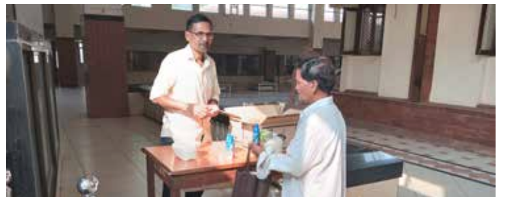
दिवाळीनिमित्त खोबरेल तेल, साबण वाटप