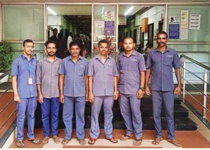
भ.क.ल.वालावलकर रुग्णालयात काम करणारे स्थानिक कामगार