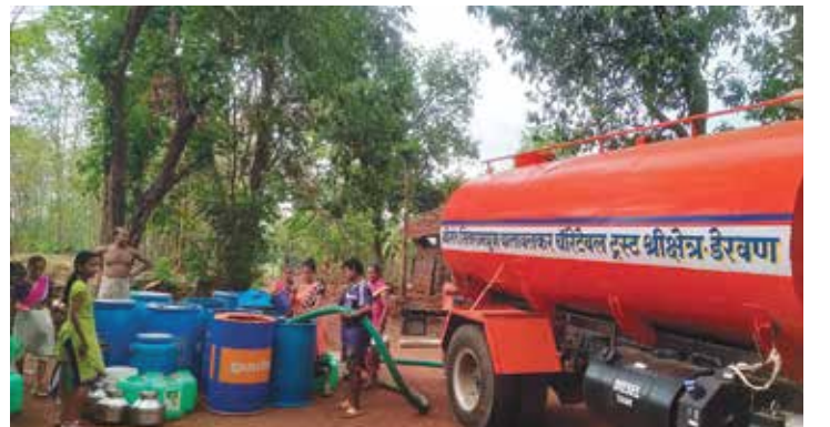
सावर्डे येथे टॅन्करद्वारे मोफत पाणीपुरवठा