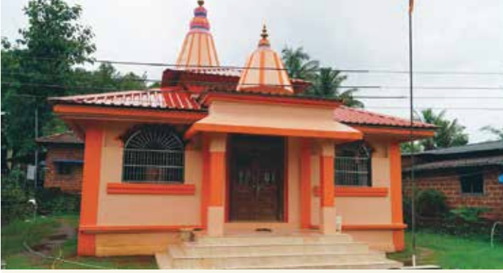
विठ्ठल-रखुमाई मंदिर चव्हाणवाडी