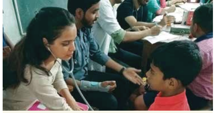
अंगणवाडीतील मुलांची आरोग्य तपासणी

सामुदायिक वाढदिवस ९ एकूण लाभार्थी ३५१, अंगणवाडी मेळावे २४ एकूण लाभार्थी चिपळूण १६० दापोली २०