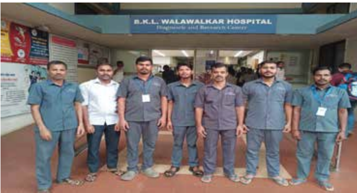
भ.क.ल.वालावलकर रुग्णालयात काम करणारे स्थानिक कामगार