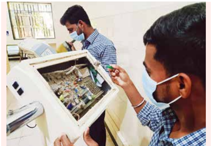
SVJCT समर्थ एज्युकेशनल इन्स्टिट्यूट - बी.एससी. बायोमेडिकल इन्स्ट्रुमेंटेशन'चे प्रशिक्षणार्थी

सर्व विषयातील पदवीधारक विद्यार्थी पुढे पदव्युत्तर पदवी तसेच Ph.D. करू शकतील तसेच स्वतःचे उद्योग उभारून वेगळ्या वाटेवर यशस्वी होऊ शकतील.