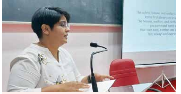
मे. आर्चीस सबनीस - सैन्य दलातील नोकरीच्या विविध संधींची माहिती