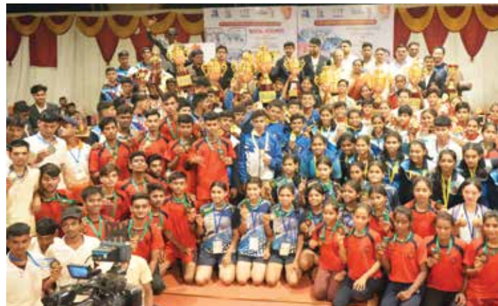
अपूर्व उत्साह आणि प्रतिसाद