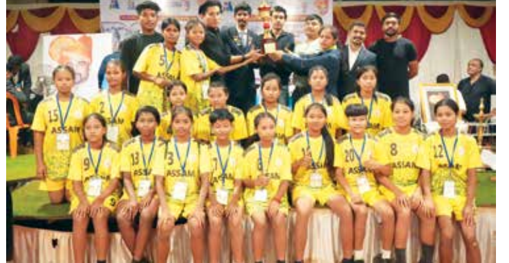
आसामचा मुलींचा संघ