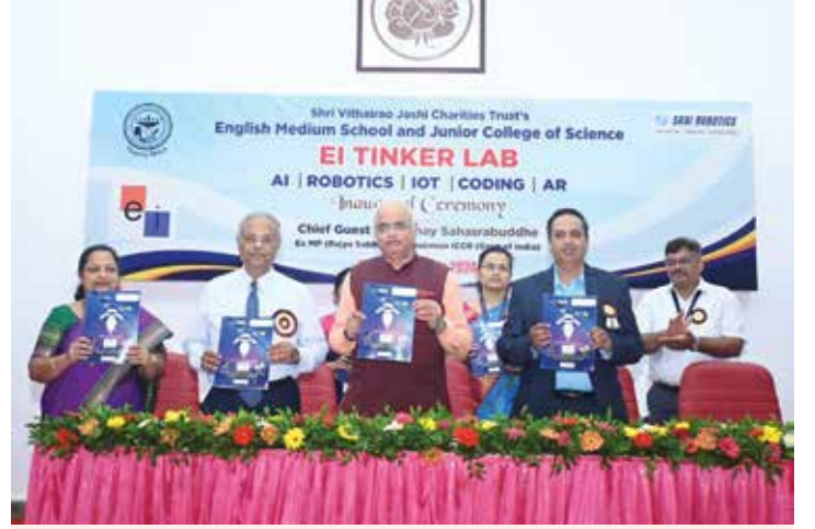
प्रमुख पाहुण्यांच्या हस्ते स्वाध्याय पुस्तिकेचे अनावरण